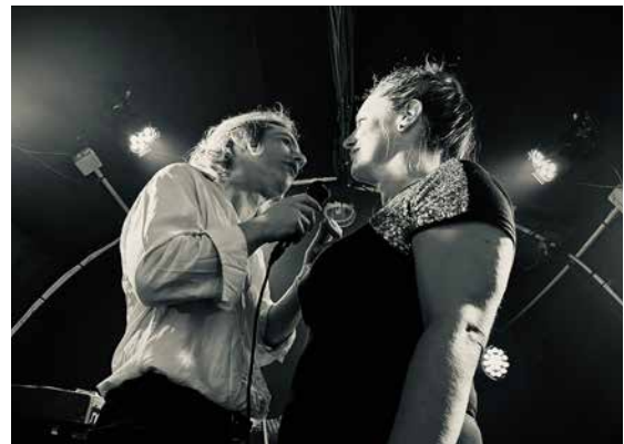
Concert dessiné à La Mécanique Ondulatoire à Paris, au Lion's Club à Mandres-les-Roses, au village pré-ludien de Chomo à Achères-la-Forêt, au festival le 909 à Saint-Amans.